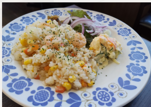
昔ながらの 洋風ピラフ