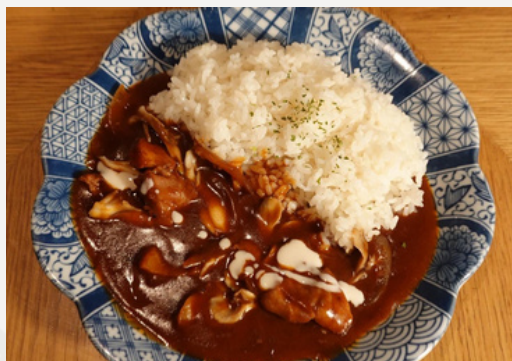
蔵時の濃厚ハヤシライス