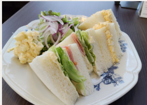
栄養バランス満点 蔵時サンドウィッチ