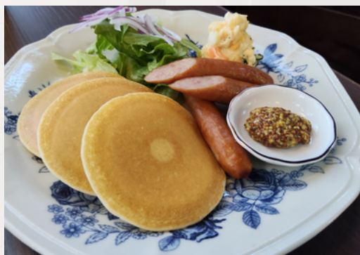
甘辛が癖になる パンケーキプレート