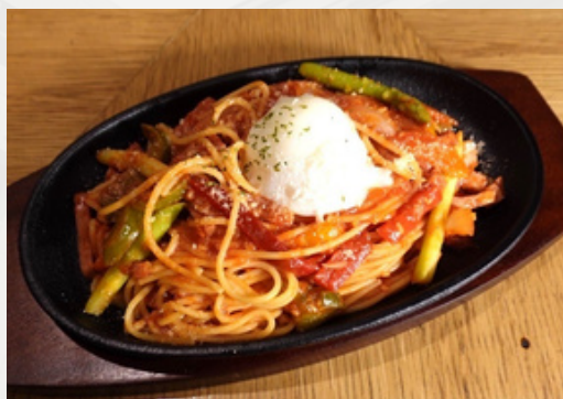
昔ながらの 鉄板ナポリタン