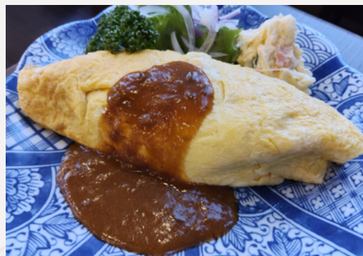
懐かしのシンプルオムライス ～デミグラスソース～